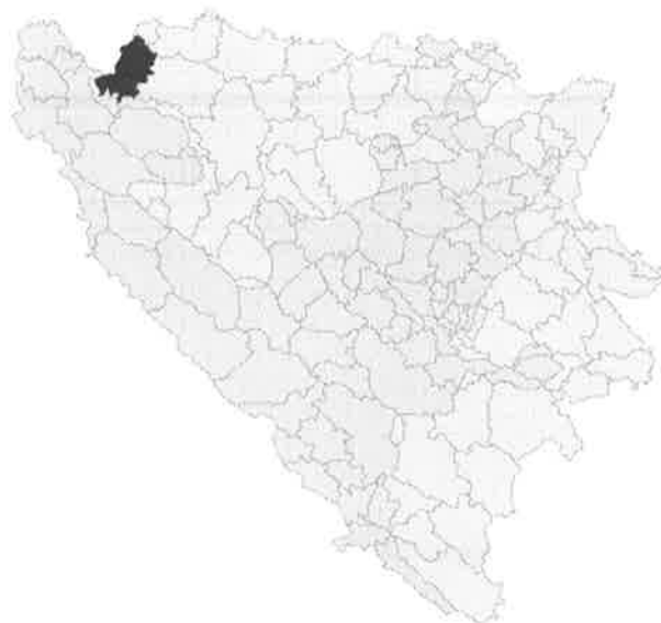
Слика 1. Географски положај општине Нови Град

Простор општине је везан за средњи и доњи ток ријеке Уне и доњи ток ријеке Сане. Општина је, долином Уне и Сане, жељезничким и друмским саобраћајем повезана са ширим дијелом јужног балканског полуострва.