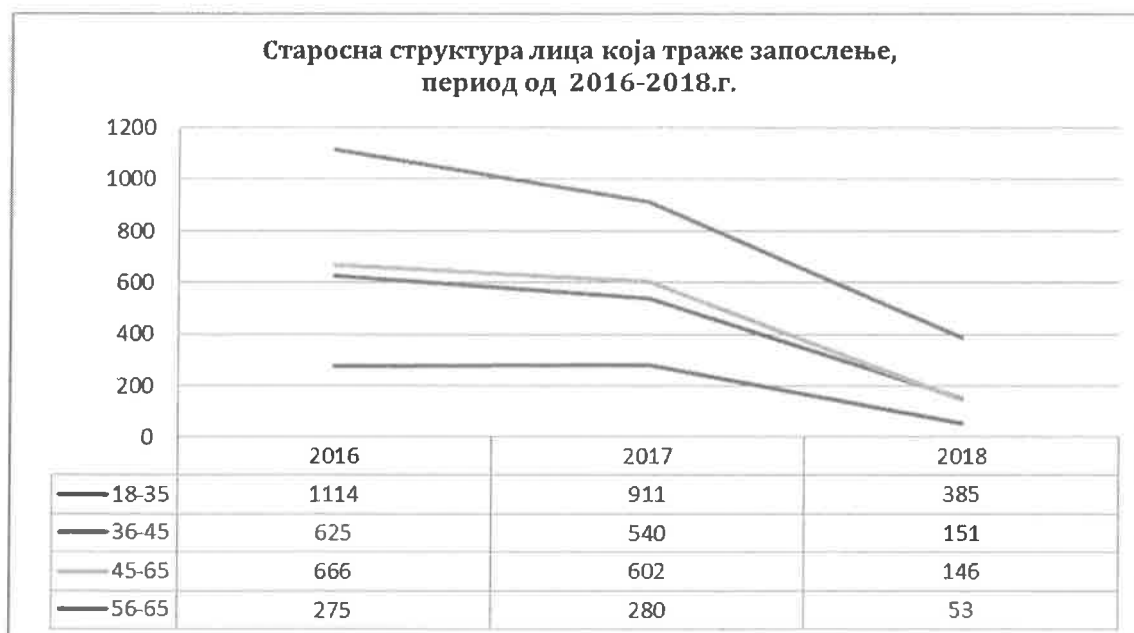
Графикон 1: Старосна структура лица која траже запослење, у периоду од 2016-2018. године

Извор: Републички завод за статистику РС, „Градови и општине Републике Српске 2018“, Завод за запошљавање